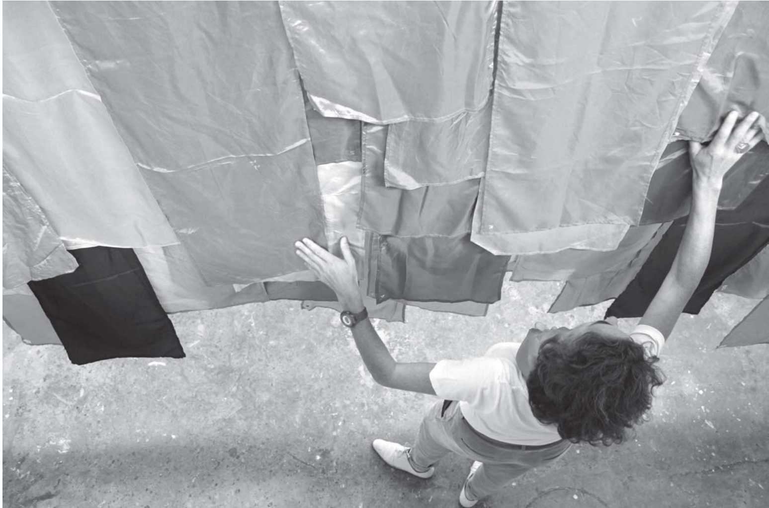
The world in its true colors/ O mundo nas suas verdadeiras cores, 2011 Dimensões variáveis/ Several dimensions.

225 tiras de seda (100%) de 75 cores diferentes que se repetem 3 vezes. Cada tira de seda tem 36x200cm e tem bordado APQ em diferentes cores; Fio de nylon; agrafos; edição de artista/ folio, impresso sobre papel IOR 160gr; texto em vinil autocolante.