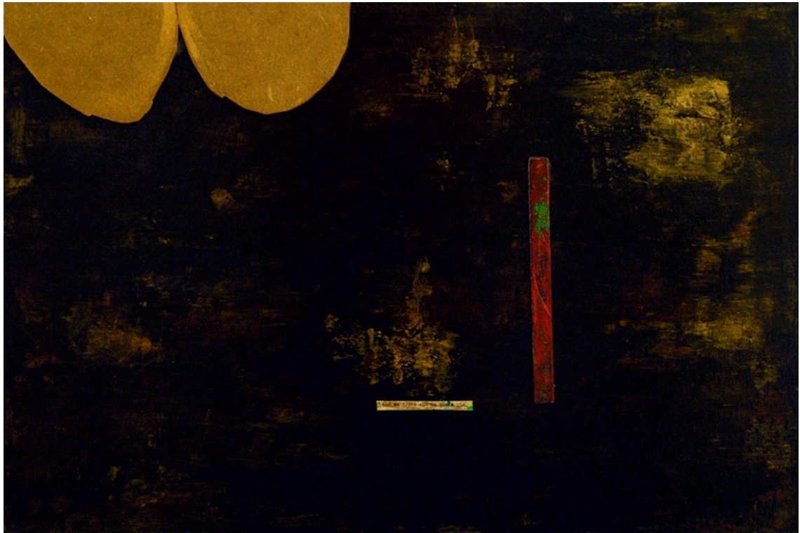
Molly. Acrílico com assemblage sobre mdf. 40x60